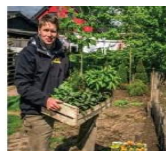
Erkuter und Blumen sind Tagetes schützen ihr Gewächs vor Schädlingen

Dieses Wissen ist Gold wert für Hobbygärtner, denn es verbessert die Erträge und spart Chemie. Kartoffeln und dicke Bohnen wachsen zum Beispiel besonders gut zusammen. Dill liebt es, zwischen Gurkenstängeln zu wachsen. Am Ende darf er ja auch mit ins Einweckglas. Und es gibt sogar Pflanzen, die den Geschmack Ihres Nachbarn verbessern: Kartoffeln sind besonders wohlschmeckend, wenn Kumpel oder Koriander daneben wächst. Dill und Möhren beeinflussen sich ebenfalls positiv. Und Krause macht Radisheschen schauf- rein geschmacklich, natürlich. Einige Kombinationen sind gemeinsam stark gegen Schädlinge. Schmeckeliebe schützt Kohl vor Raupen und Erdflöhe. Auch der Duft von Rosmarin wie Salbei, Thymian und Pfefferminze hält den Koboldwürger und andere Falter fern. Das Aroma des Bohnenkrauts schützt Bohnen vor schwarzen Läusen. Oder Ringelblumen und Tagetes: Sie machen Ihren Obst- und Gemüsegarten nicht nur schöner, sondern wehren aktiv Schädlinge ab. Kapuzinerkresse und Gartenkresse sollen Tomaten und sogar Obstbäume vor Blatt- und Blattläusen schützen. Eine Wer-mit-wem-Liste mit den üblichen Verdächtigen finden Sie im Anhang (Seite 126).