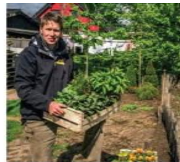
Erbsen und Bohnen sind gute Nachbarn und schützen Ihr Gemüse vor Schädlingen.

Dieses Wissen ist Gold wert für Hobbygärtner, denn es verbessert die Erträge und spart Chemie.