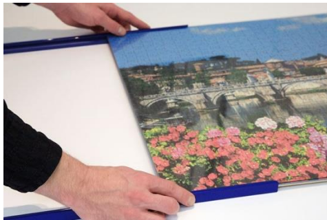
Die Puzzlerahmen werden seitlich aufgesteckt ohne das Puzzle umzudrehen.

bruchssichere und leichte Acrylglasplatte wird anschließend auf das fertige Puzzle gelegt und der Rahmen seitlich aufgeschoben. Somit ist das kritische Über-Kopf-Drehen beim Einrahmen nicht mehr nötig. Die Anpresslippe im Profil wurde speziell für die Puzzlestärke modifiziert und drückt die Platte fest auf die Puzzlestücke - es ist kein Kleben notwendig. Ebenso einfach kann der Puzzlerahmen wieder auseinandergebaut und wiederverwendet werden.